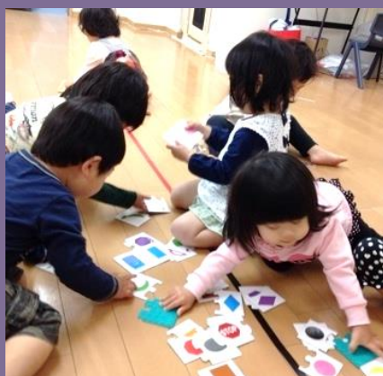
就学前プログラム (文字・数量)