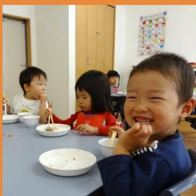
栄養士作成の献立 による手作り給食