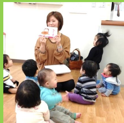
専門講師による 英語との触れ合い