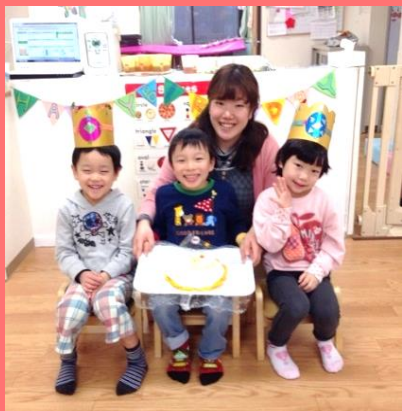
家庭的な ふれあい保育