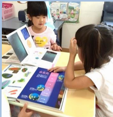
あそびや生活を通 しての学び