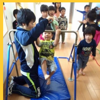
なないろキッズ 体操の実施